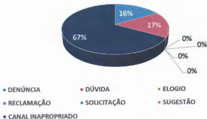
GRÁFICO 2 - TOTAL DAS DEMANDAS RECEBIDAS NA OUVIDORIA

Conforme demonstra o Gráfico 4, o único canal de acesso à Ouvidoria utilizado pelos cidadãos/ usuários da Câmara Municipal, no primeiro trimestre de 2019, foi a internet, com um total de 7 registros, representando 100% das demandas recebidas.