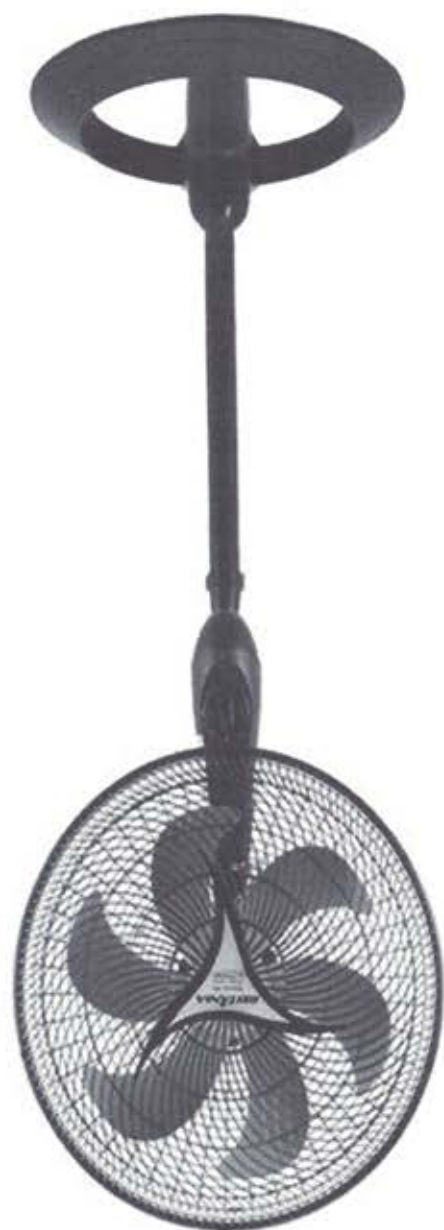
Ventilador de columna