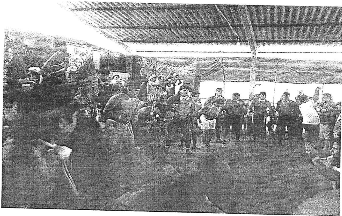
Foto 4 : Apresentação Cultural do A'uwé Ubtabi – Xavante na durante III Assembleia Geral dos Povos Indígenas do Estado de Mato Grosso na Aldeia Rio Verde, Terra Indígena Parecis/Setembro/2017.

O amistoso tem objetivo de realizar aos jovens indígena xavante o sonho de ser jogador profissional, no Gavião Kyikatejê Futebol Clube. O Clube Gavião Kyikatejê, é o primeiro time indígena a ter acesso à primeira divisão paraense. O resultado derrota de 2 a 1 para o tradicional Paysandu, em Belém ficou em segundo plano. O Gavião chamou a atenção por ser o primeiro clube profissional de origem indígena do Brasil.