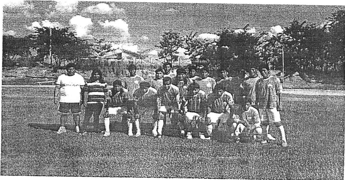
Foto 2 : Copa Regional de Barra do Garças – Secretaria de Esporte e Lazer/Setembro/2017.